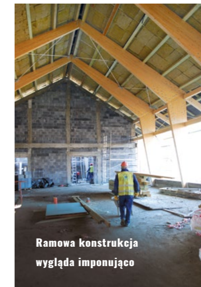
Ramowa konstrukcja wygląda imponująco

„Utworzenie Centrum Edukacji Ekologicznej wraz z zagospodarowaniem Potoku Czechowickiego” to zadanie, w ramach którego przewidziano inwestycje przyczyniające się do zatrzymania degradacji cennych przyrodniczo gatunków roślin i zwierząt mających swoje siedliska w dolinie potoku oraz budowę ośrodka prowadzącego działania promocyjne i edukacyjne, związane z bioróżnorodnością. Całościowo inwestycja kosztować będzie przeszło 18 milionów złotych i powinna zakończyć się w przyszłym roku. Większość tej kwoty – aż 15,5 miliona złotych – nie obciążą jednak gminnego budżetu, gdyż zostanie sfinansowana ze środków Europejskiego Funduszu Rozwoju Regionalnego i z budżetu państwa w ramach Regionalnego Programu Operacyjnego Województwa Śląskiego na lata 2014-2020 – Oś Priorytetowa V „Ochrona środowiska i efektywne wykorzystywanie zasobów” Działanie 5.4 „Ochrona różnorodności biologicznej” Poddziałanie 5.4.3. „Dziedzictwo kulturowe – konkurs”. Od lutego 2018 roku inwestycja znajduje się na zatwierdzonej przez Zarząd Województwa Śląskiego liście projektów zakwalifikowanych do dofinansowania. Przedsięwzięcie uznane zostało za jeden z tzw. projektów kluczowych, czyli najważniejszych w całym regionie. (IZD/UM, SR/UM, Red. | Red.) ■