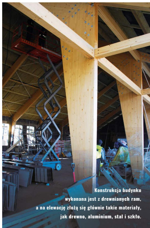
Konstrukcja budynku wykonana jest z drewnianych ram, a na elewację złożą się głównie takie materiały, jak drewno, aluminium, stal i szkło.

Centrum Edukacji Ekologicznej położone będzie w pięknym otoczeniu przyrody i obiektów historycznych, w pobliżu zabytków przyrodniczych i architektonicznych, w Czechowicach Górnych, przy granicy z Czechowicami Dolnymi, w pobliżu historycznych zabudowań pałacowych i dworskich, a także pomników