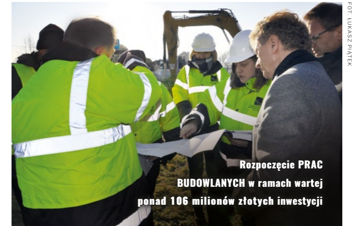
Rozpoczęcie PRAC BUDOWLANYCH w ramach wartej ponad 106 milionów złotych inwestycji

5 grudnia br. rozpoczęły się prace przy budowie DRUGIEGO ETAPU KANALI- ZACJI sanitarnej na terenie gminy.